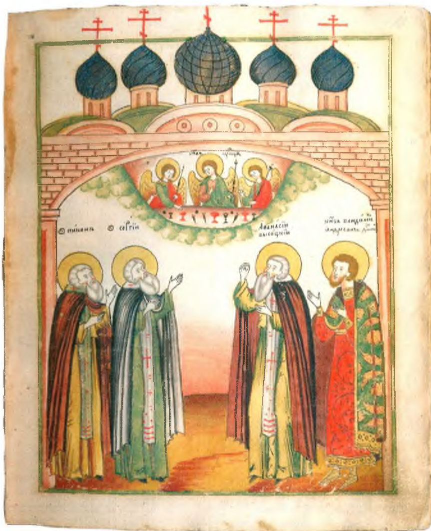
Преподобные Никон Радонежский, Сергий Радонежский, Афанасий Высоцкий и князь Владимир Андреевич Храбрый. Миниатюра Вкладной книги Высоцкого монастыря.

Монастырь был основан в 1374 году устройением серпуховского князя Владимира Андреевича Храброго, двоюродного брата и сподвижника великого князя Дмитрия Донского. Князь